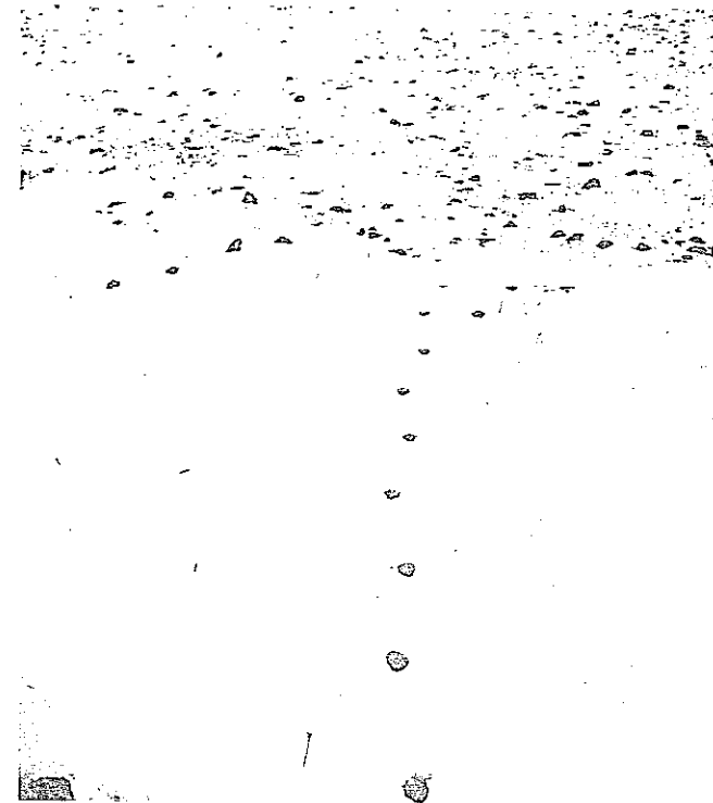
¿Campo de huellas o línea de lobo?

Aquel día, el Hombre de los lobos se levantó del diván más cansado que de costumbre. Sabía que Freud tenía la genialidad de rozar la verdad, pasar de largo, y suplir luego el vacío con asociaciones. Sabía que Freud no entendía nada de lobos, de anos tampoco, por cierto. Freud sólo entendía de perros, de colas de pe-