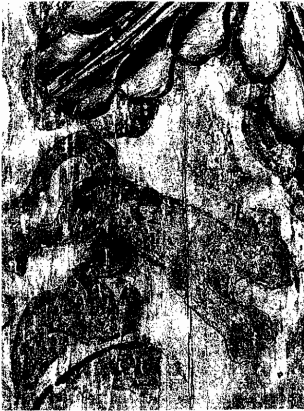
Pintura mural. Detalle con fauna de la región. CORO IGLESIA DE SANTA CLARA, BOGOTÁ

participar abiertamente en un “diálogo nacional” real [...]. De esta forma, los ciudadanos reescribirán, repensarán y reinterpretarán la historia y la transformarán a la luz de nuestros valores fundadores, los cuales son la democracia y la libertad [...] (Alta Consejería Presidencial para el Bicentenario de la Independencia) 8 .