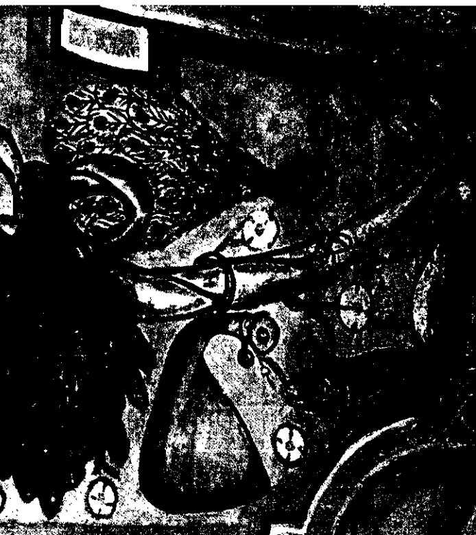
Pintura mural. Detalle de pintura alegórica con flora y fauna del trópico | CASA DE JUAN DE CASTELLANOS, TUNJA FOTOGRAFÍA LUIS CRUZ | EL SELLO EDITORIAL