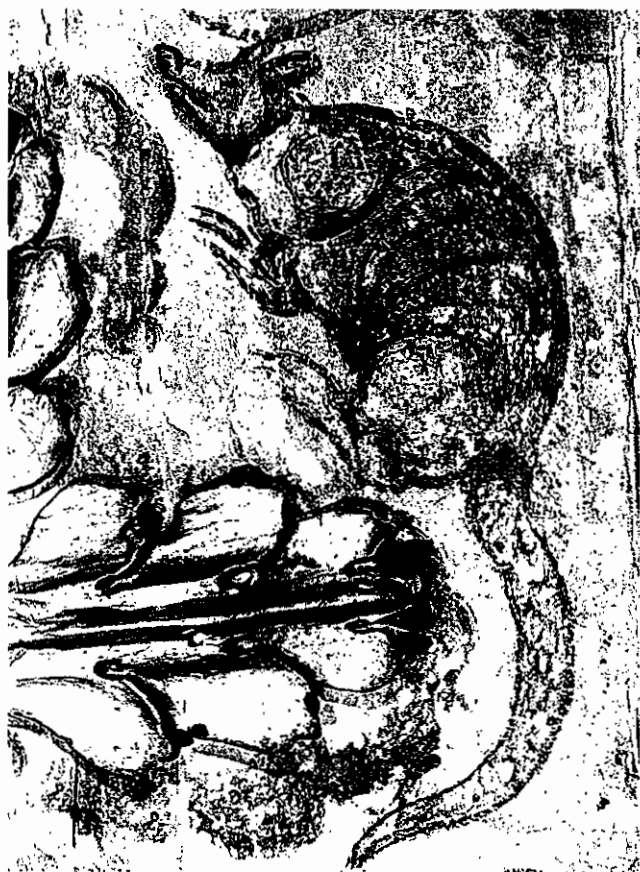
Pintura mural. Detalles con fauna de la región.

CORO IGLESIA DE SANTA CLARA, BOGOTÁ | EL SELLO EDITORIAL