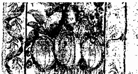
Pintura mural. Detalle de decoración con elementos mestizos. CORO IGLESIA DE SANTA CLARA, BOGOTÁ | FOTOGRAFÍA MAURICIO OSORIO | EL SELLO EDITORIAL

rentes sectores sociales, los escenarios oficiales mantienen una retórica de la colombianidad como proyección de los imaginarios e historicidad de las élites políticas e intelectuales. Élite que, por lo demás, siguen siendo predominantemente eurodescendientes y eurocentradas. La exclusión de negros e indígenas es muy distinta hoy que hace doscientos años. El discurso de la modernidad y del progreso de principios del siglo XX ha dado paso al de la democracia y el multiculturalismo. Por tanto, hoy se convoca a negros e indígenas, así como a sectores populares y de las regiones, para que aparezcan incluidos de acuerdo con las prédicas multiculturalistas y de la participación, pero se hace para legitimar un proyecto de colombianidad agenciado por las élites. El proyecto eurocéntrico de la interpretación de la Independencia sigue vigente, aunque en otras vestiduras. Y, como hace doscientos o cien años, en los procesos y los sucesos de lo que se registra como la Independencia y que se vuelve objeto de celebración, muchos son los escandalosos silencios.