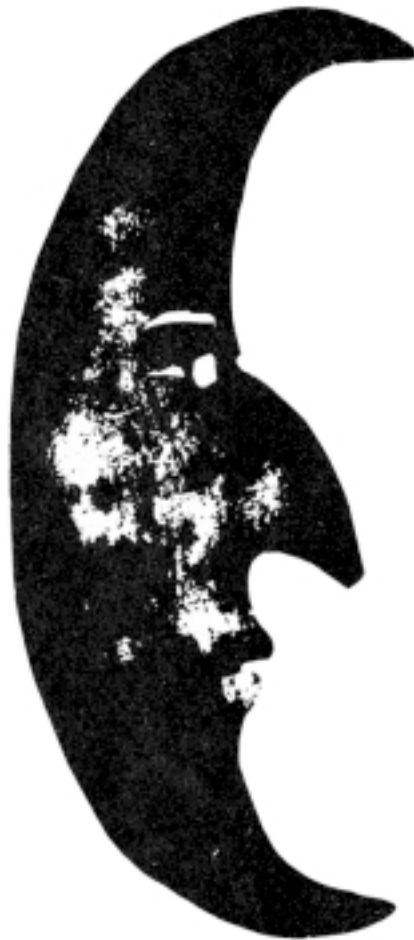
Hans Christian Andersen (Dinamarca 1805-1875), collage.

Como se puede apreciar, el presente número de NÓMADAS ofrece una serie de artículos de balance de los resultados empíricos, teóricos, metodológicos y de experiencia articulados con varias de las líneas y grupos de investigación del IESCO. Otro conjunto de artículos aborda diferentes temáticas que son nue-