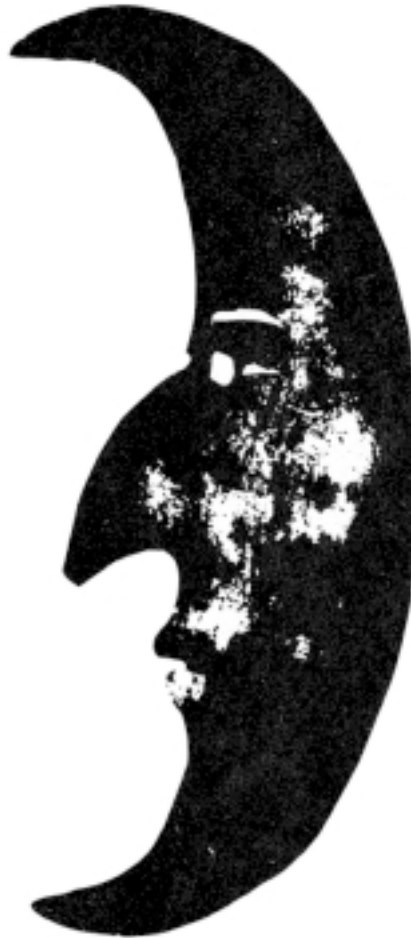
Hans Christian Andersen (Dinamarca 1805-1875), collage.

una de sus vertientes más interesantes, constituyen una conceptualización sin garantías , es decir, sin reduccionismos de ninguna clase. Por tanto, siempre están atentos a comprender, desde lo concreto y en su singularidad, los densos amarres e intersecciones entre el poder y la