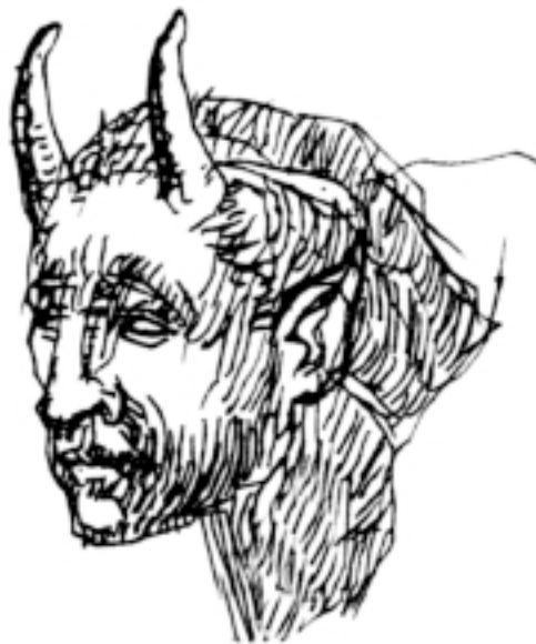
Darío Villegas: de sus cuadernos.